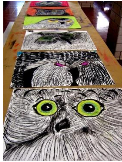
'owls' kids project