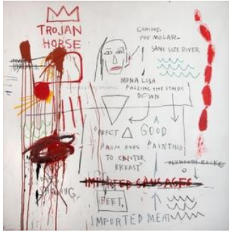
'words are all we have' Basquiat