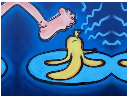
'Moment of banana' Jasper M