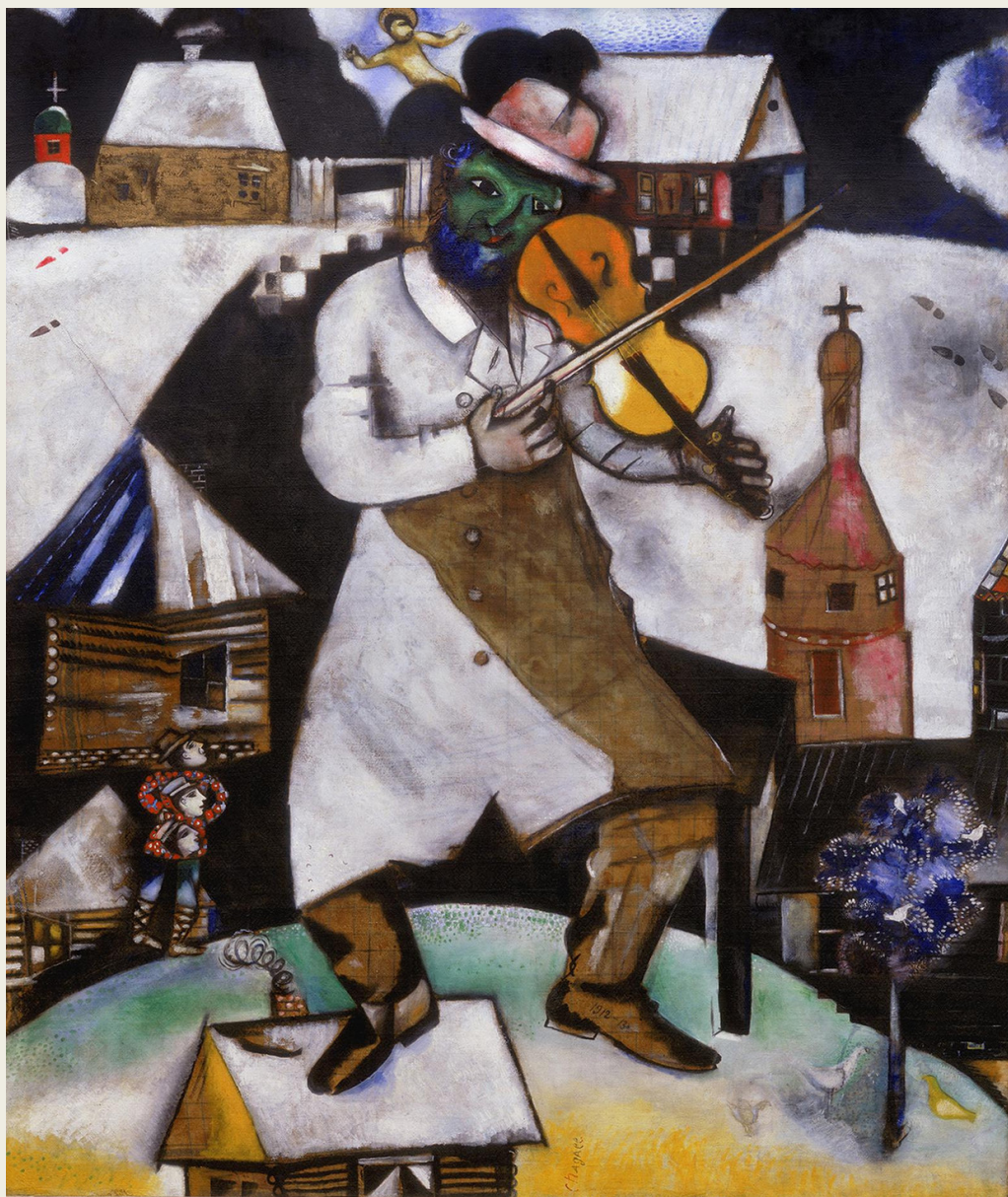
Marc Chagall, Le violoniste