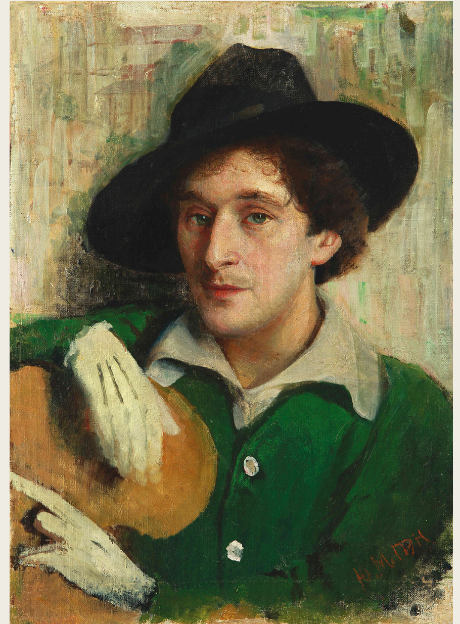
Portret van Marc Chagall, Yehuda Penn, 1915