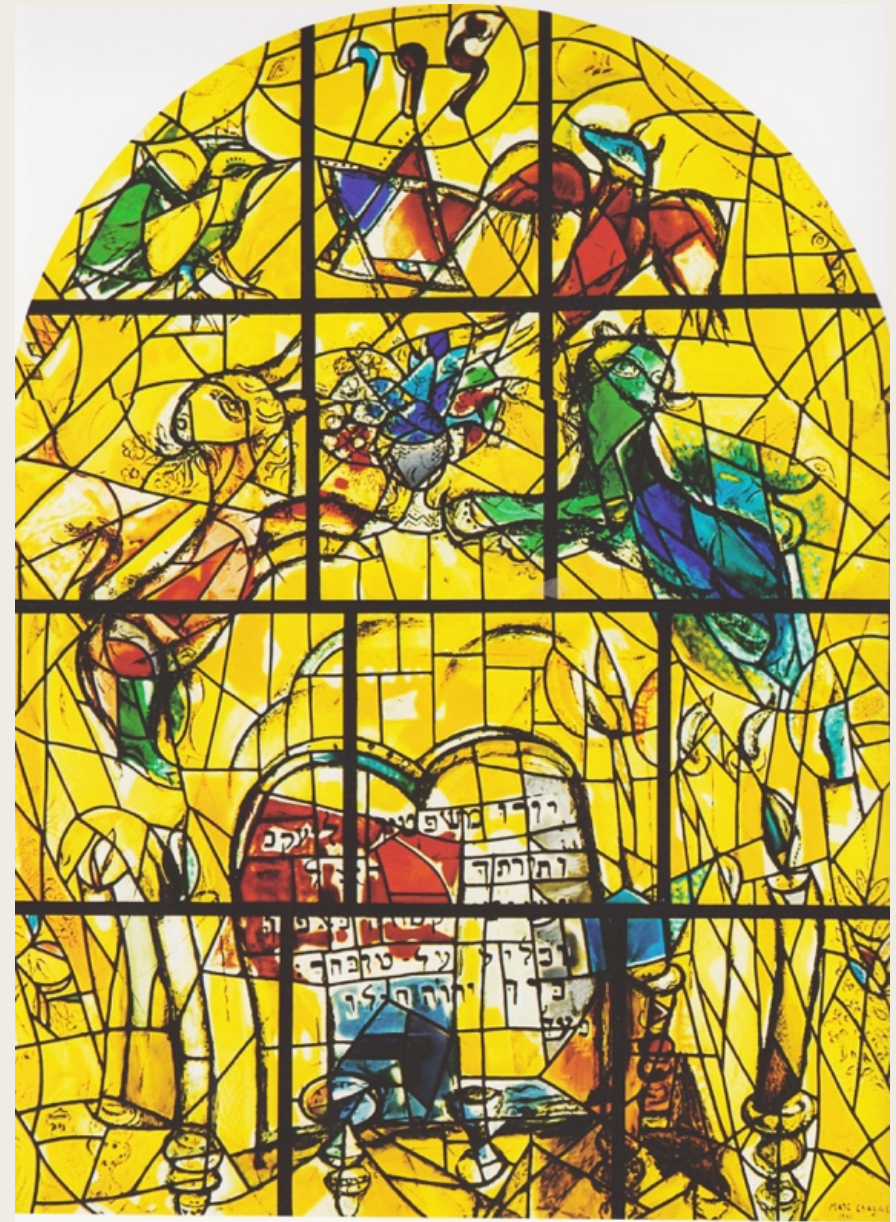
Marc Chagall, De twaalf stammen van Israël Glas in Lood, 1960