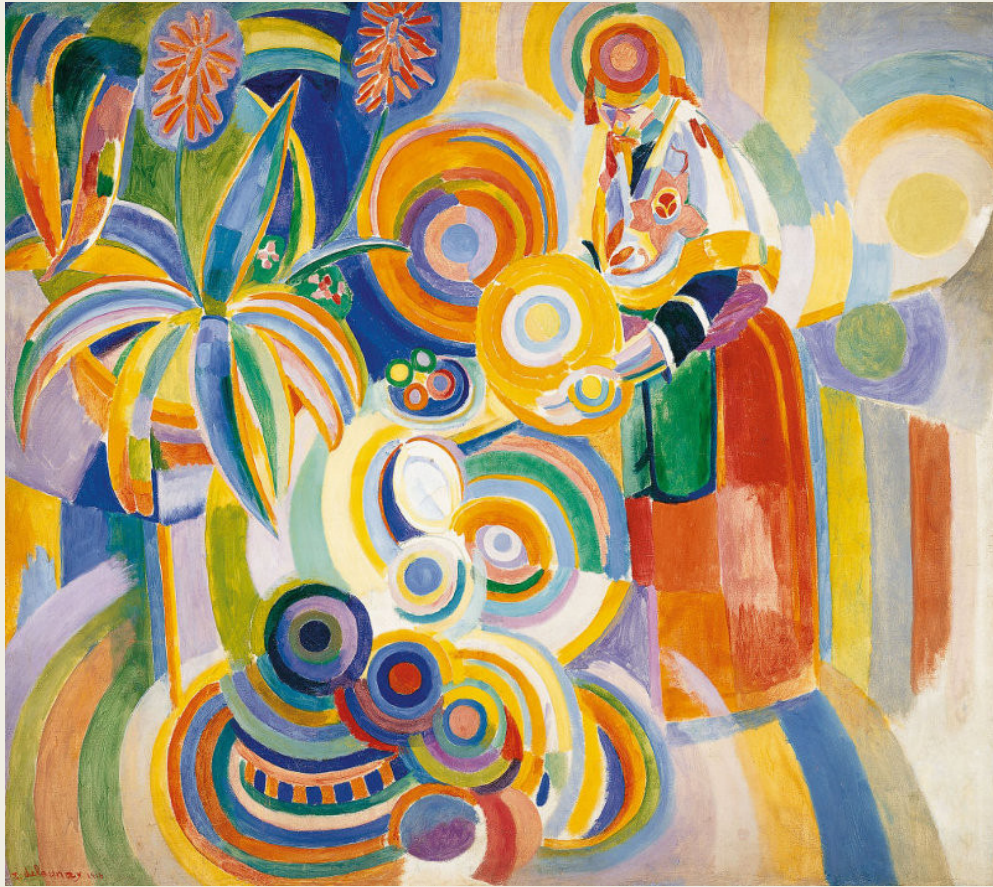
Robert Delaunay, Rijzige Portugese vrouw, 1916