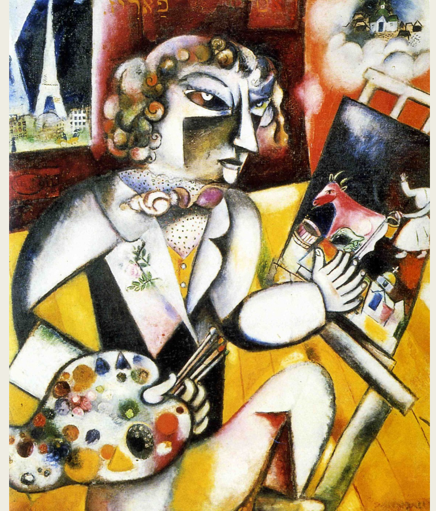
Marc Chagall, 1914, Autoportrait aux sept doigts Huile sur Toile