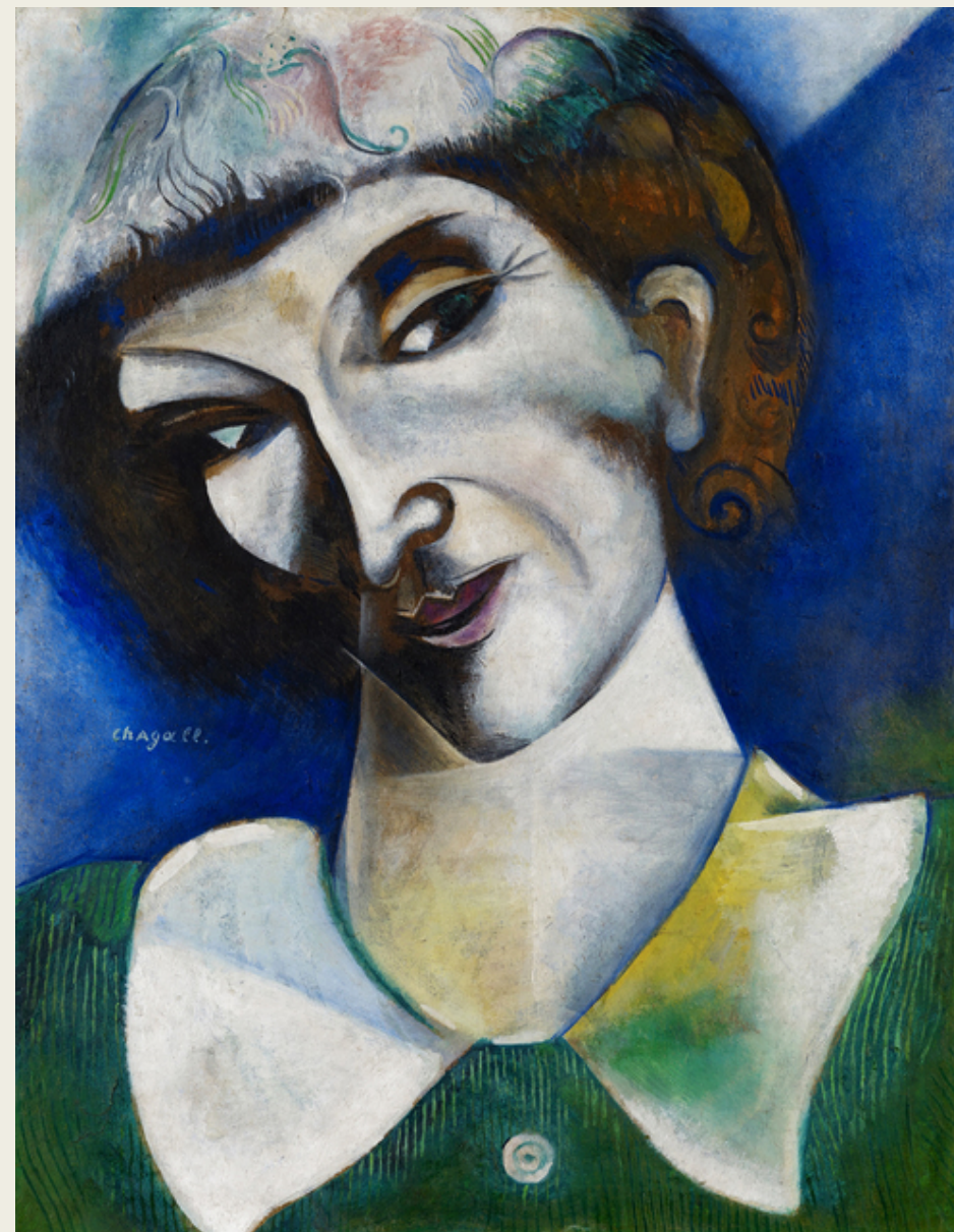
Marc Chagall, Zelfportret, 1914