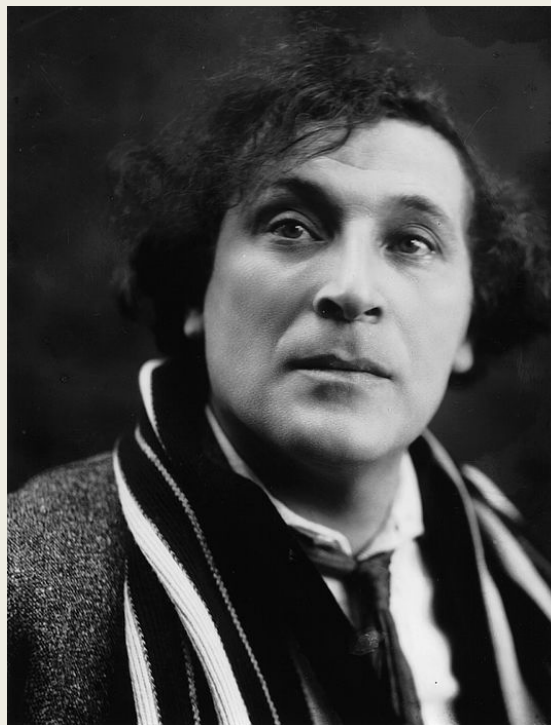
Portret foto, 1920