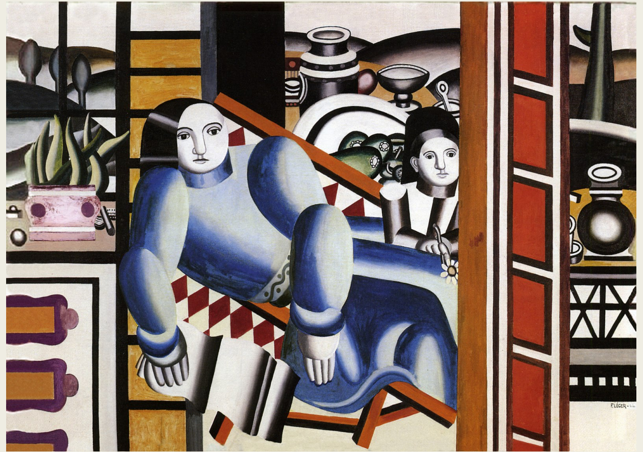
Fernand Léger, Moeder en kind, 1922