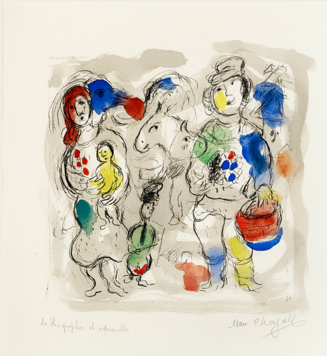
Marc Chagall, Petits Paysans I , Lithografie/aquarelle, 1968